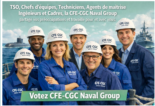
TSO, Chefs d'équipes, Techniciens, Agents de maîtrise Ingénieurs et Cadres, la CFE-CGC Naval Group partage vos préoccupations et travaille pour et avec vous.

Le bulletin d'information de la CFE-CGC Naval Group